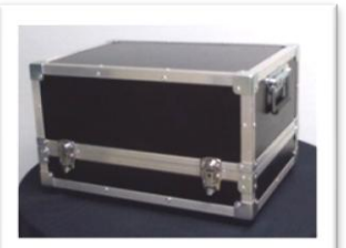
Mallette pour aménagement de poste et transport

(OPxxxx) petite : 290 x 250 x 310 mm - poids à vide : 5 kg