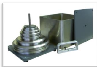
Boîte de transport métal

(OP0101) : 260 x 260 x 310 mm - poids à vide : 6 kg