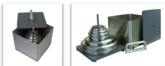
Boite de transport métal

(OP0101) : 260 x 260 x 310 mm - poids à vide : 6 kg