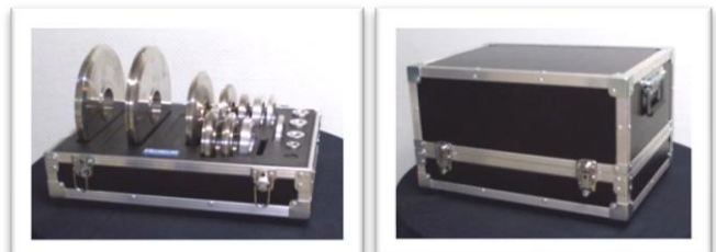
Mallette pour aménagement de poste et transport

(OP0101) : 260 x 260 x 310 mm - poids à vide : 6 kg