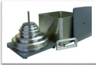
Boîte de transport métal (OP0101) : 260 x 260 x 310 mm - poids à vide : 6 kg