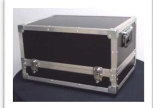
Mallette pour aménagement de poste et transport (OPxxxx) grande : 355 x 505 x 310 mm - poids à vide : 13 kg +(OPxxxx) petite : 290 x 250 x 310 mm - poids à vide : 5 kg